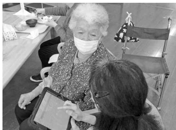
タブレットを使って健康チェック