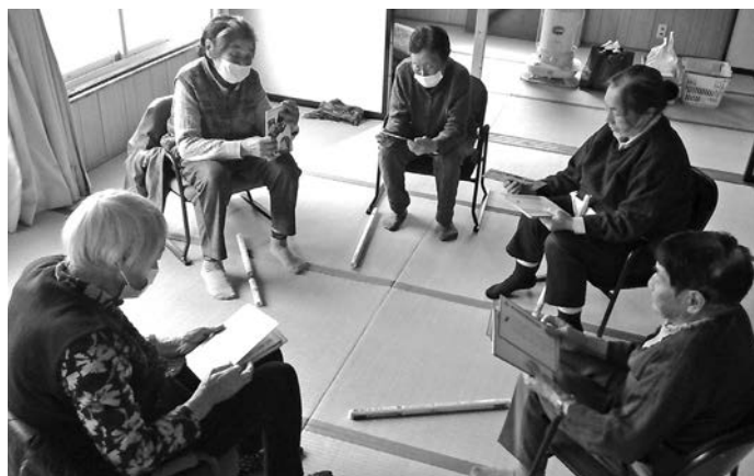
詐欺防止、予防カルタをしている様子

利用者からは、棒状に丸めた新聞紙を使った体操が特に好評で、良い運動になるという声が多くあります。寿サロンでは、「サロンへ行きたいが、行く足が無い」という地域住民の声から、午前と午後に分け、2ヵ所で開催するようになりました。井戸端会議を楽しめることから、参加者は、サロンの日を待ちわびています。