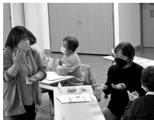
手話サークルどんぐりの支援の様子

【場 所】 遠野市総合福祉センター 「第1会議室」 (遠野市松崎町白岩字薬研淵1-3)