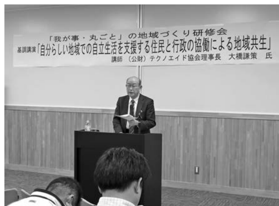
講師から地域づくりを学ぶ