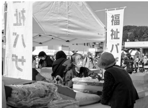
宮守バザーの様子