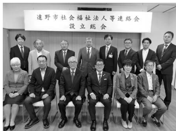
法人連携立ち上げ