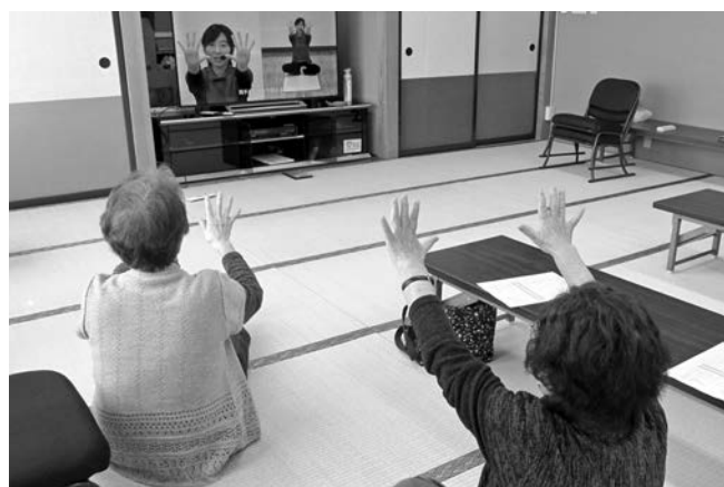
体操に取り組む様子

こがらせ園では、新型コロナウイルス感染拡大を防止するため、昼食のお弁当は折詰にして自宅に持ち帰っていただき、9時半から12時まで時間を短縮して活動を継続してきました。5月からは午後2時半まで、6月からは午後3時半までと段階的に通常利用時間帯にしていく予定です。