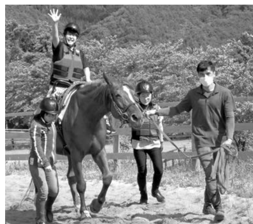
インストラクターとボランティアの生徒がサポートして体験する様子