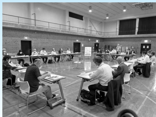
支部長会議の様子